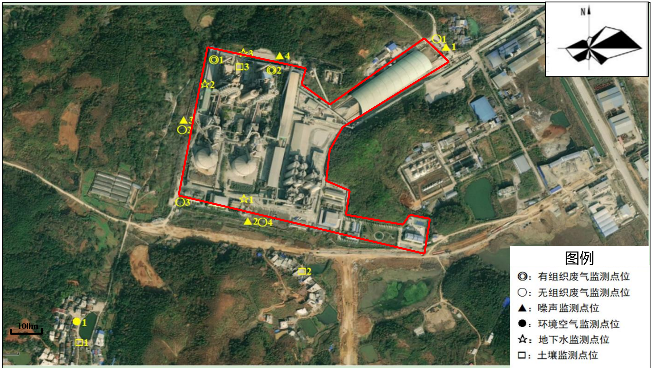
附图4 验收监测点位布设图